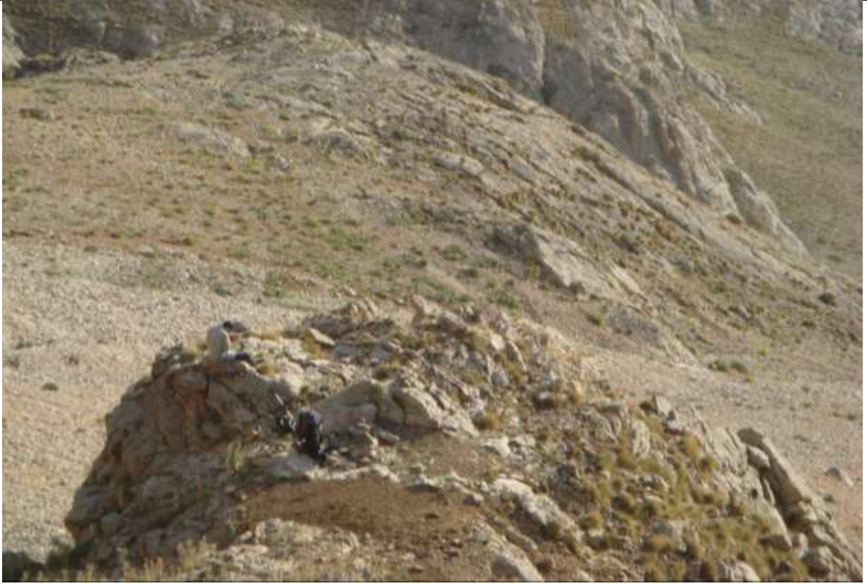
Resim 2, Kamp yerimiz