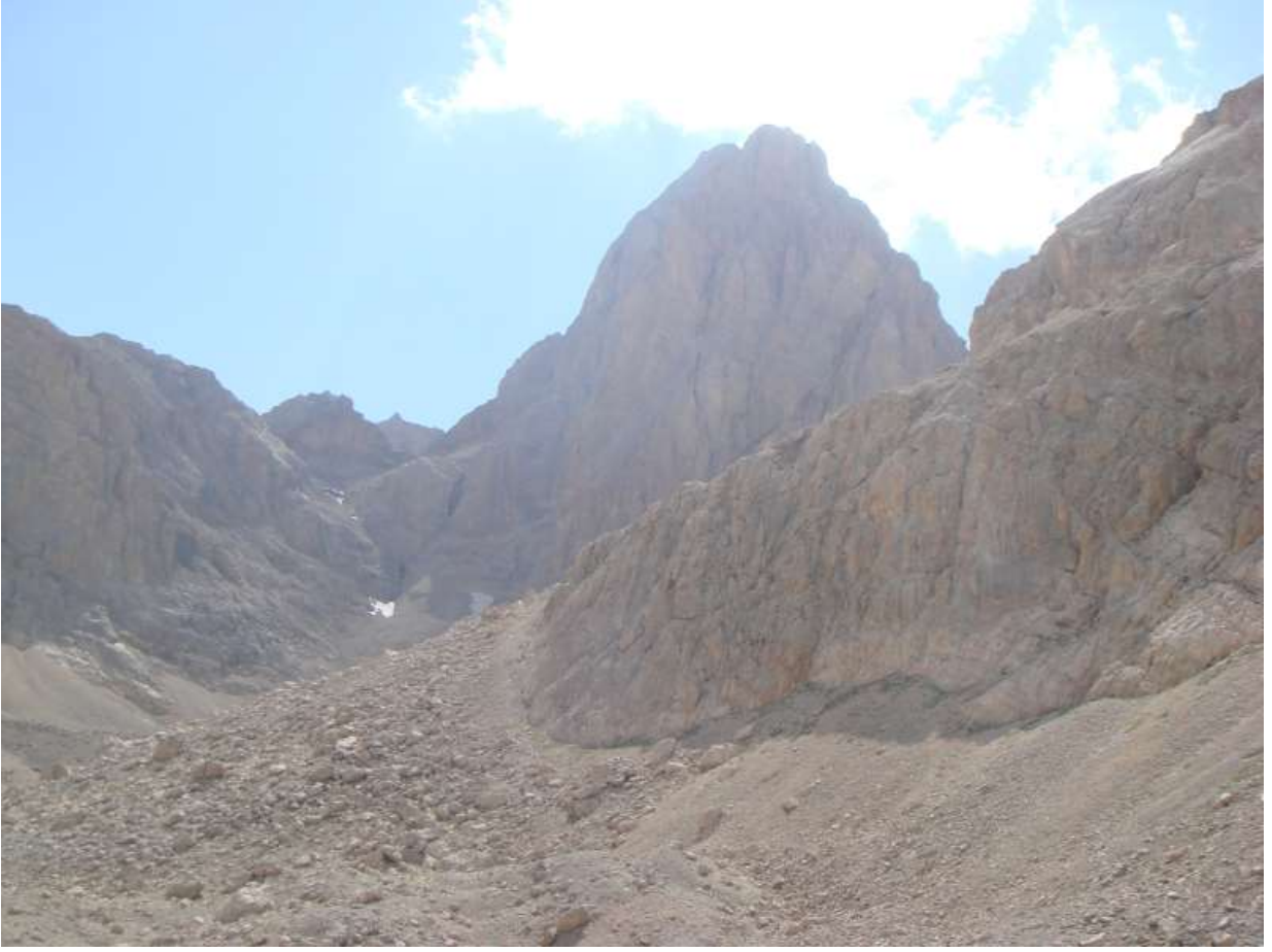
Resim 6, Dönüş yolunda Güzeller batı çanağıdankidaki patikadan geriye dönüp bakınca sağda Lahitkaya doğu yüzü, karşıda Kaldı Kuzeydoğu yüzü

Köyden kalkan Niğde minibüsünü yakalayabilmek için süratli bir şekilde toparlansak da yetişemedik, İstanbul otobüsünü de kaçırdığımız için Ankara üzerinden aktarmalı olarak İstanbulla döndük.