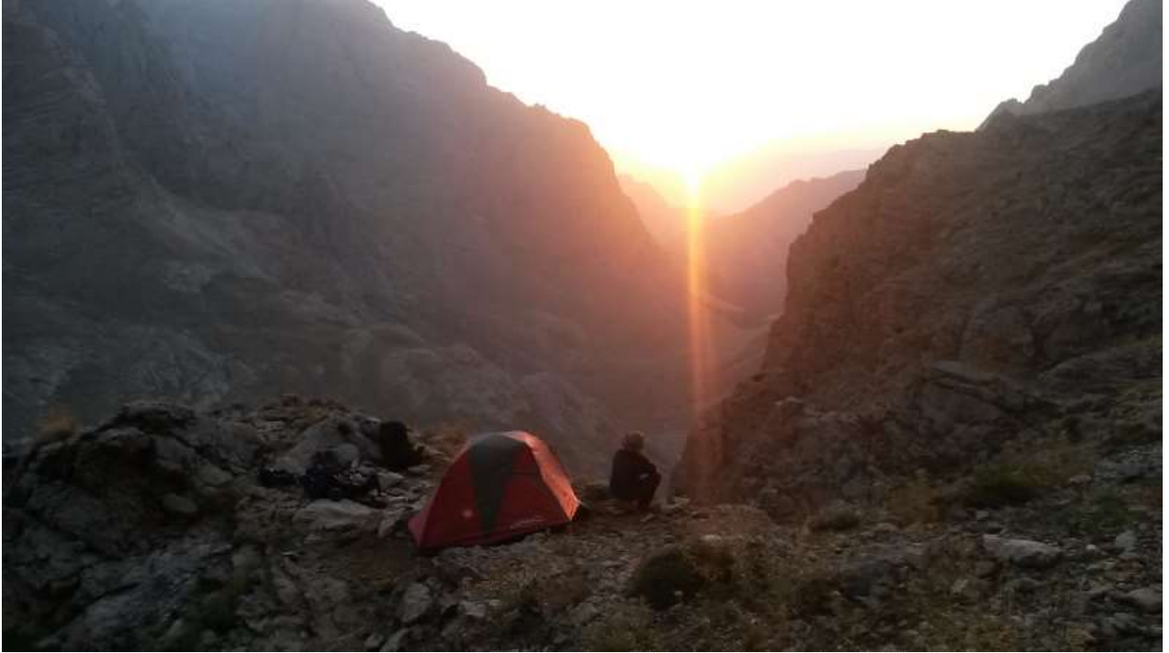
Resim 3, Meditatif kamp manzaramız

05.45 Kamptan hareket. Lahitkaya Kuzeybatı sırtını döndükten sonra başlayan yorucu çarşağı düşük tempoda, yıpranmadan tırmandık.