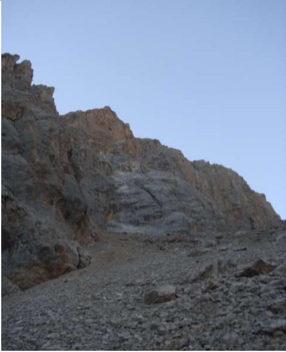
Resim 4, Çarşıktan görünen ilk boyu