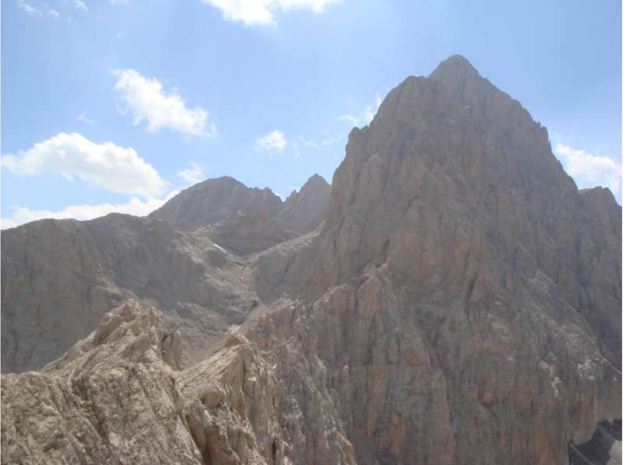
Resim 5, Zirve sırtı, Küçük Kaldı ve Kaldı

II derecelik çürük etaplardan yükselerek kısa süre sonra zirveye vardık.