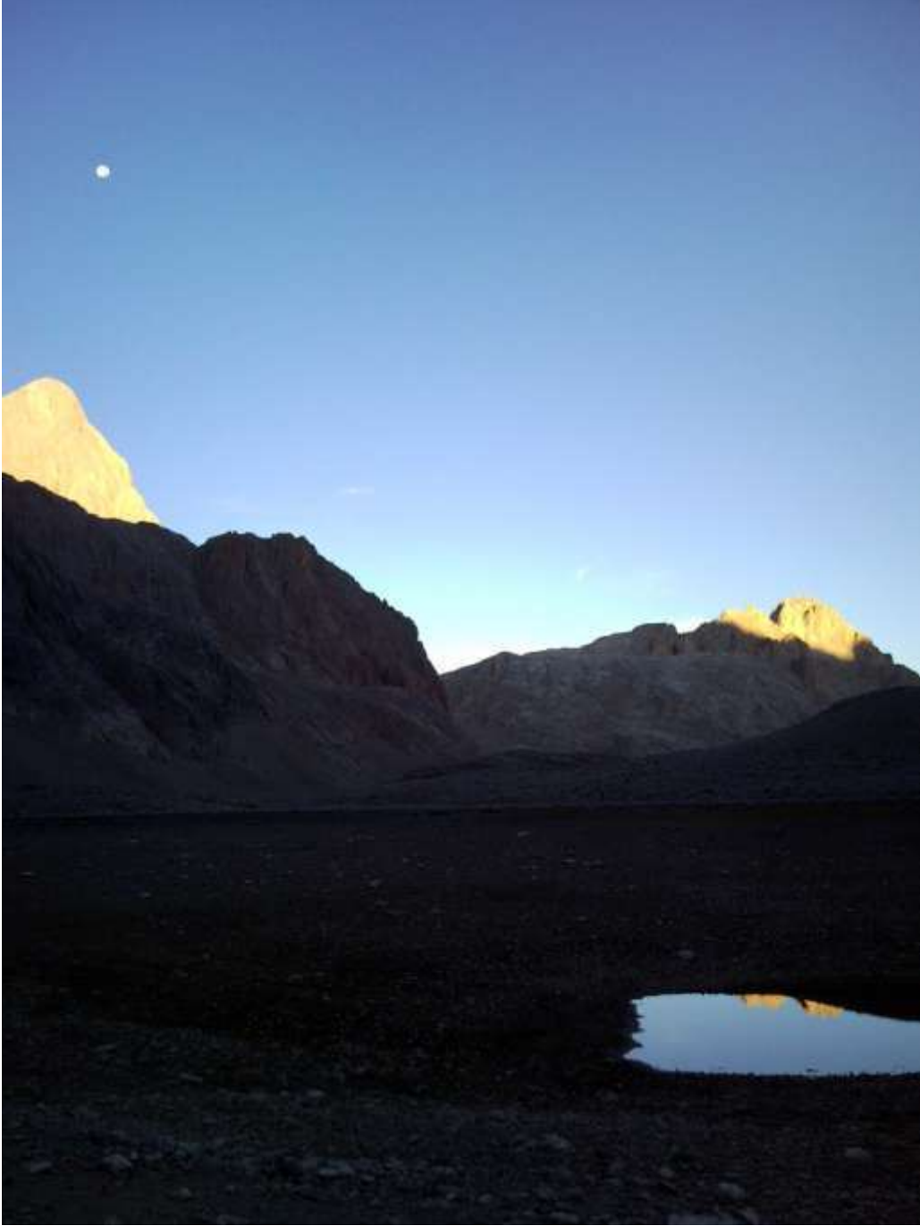
Foto 2 Dipsiz Göl-Demirkazık

7.30: Göl havzasından çıktıktan sonra inişli çıkışlı bir kaç tepeciğin sol tarafından dolaşarak Yıldızbaşı güney yüzündeki çarşağa ulaştık. Burada beliren patikanın iniş rotası olduğunu düşünsek de gölden çıkıp devam eden patikanın Akçay geçidine doğru ilerlemesi nedeniyle klasik rota bu olmalı diye düşünerek tırmanışa başladık (irtifa: ~3150mt).