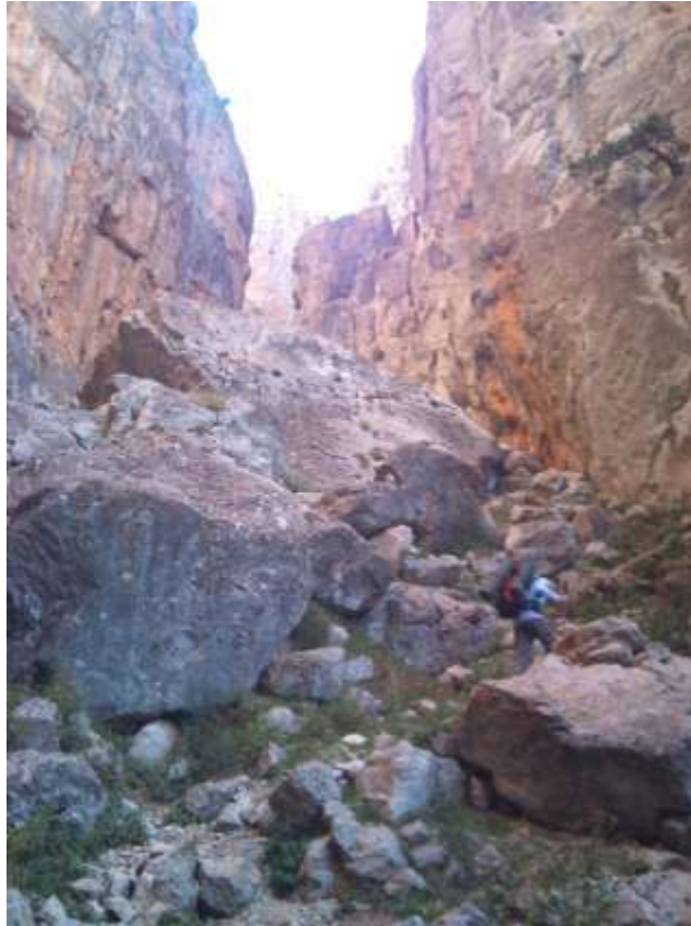
Foto 1 Cimbar vadisi

14.00: Demirkazık köyü yol ayrımından Cimbar vadisi istikametinde yürüyüşe başlandı