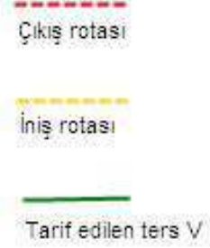
Foto 3 Çıkış ve İniş Rotaları

Bu şekilde yaklaşık 150mt irtifa aldıktan sonra çok kısa çarşak bölümlerle kesilen kaya yapısı düzleşmeye başlıyor. Bundan sonra slop yüzeyde küçük ama temiz ve sağlam tutamaklarla 100mt daha irtifa alıyoruz.