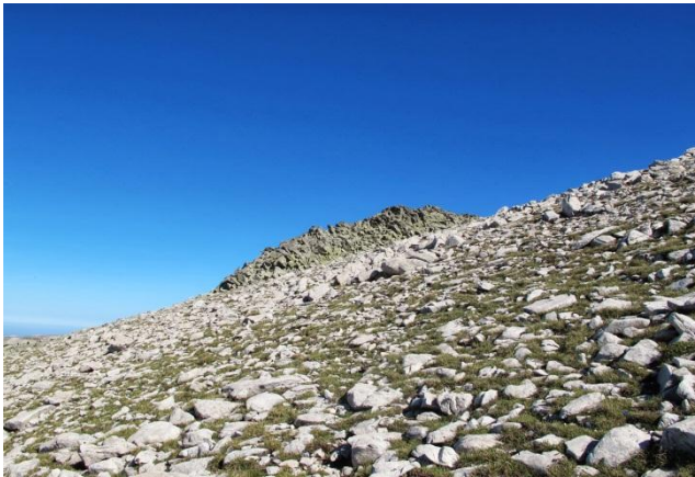
Sağımızda kalması gereken Karakayalar