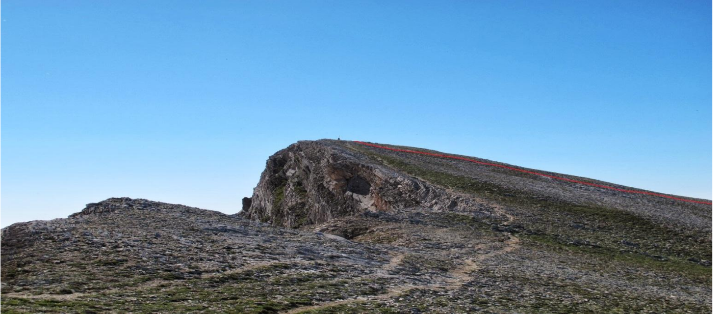
ULUDAG BUYUK ZIRVE ( gidiste goremedigimiz oldukça belirgin patika biz kırmızı çizgi gibi çıktık )