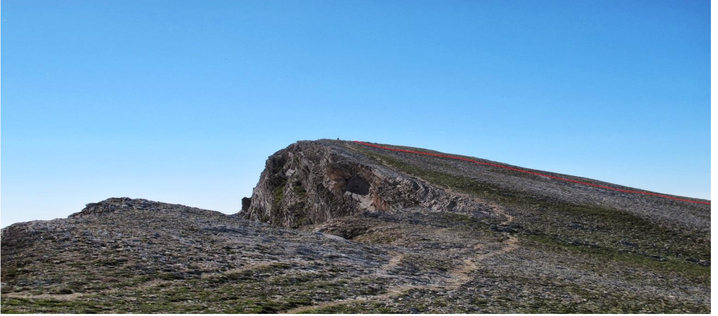
ULUDAG BUYUK ZIRVE ( gidiste goremedigimiz oldukça belirgin patika biz kırmızı çizgi gibi çıktık )