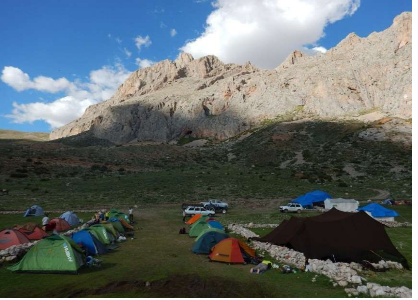
SOKULLU PINARI KAMP ALANI

Tam da bu şekilde gece 11:45 civarı kalkıp yola koyulmak üzere hazırдық. Bu yürüyüşün diğer bir güzelliği ise dolunay eşliğinde yürümektir. Hazırдық ve akşamdan hazırladığımız zirve çantalarımızı alarak yola koyulduk. Dolunay sayesinde kafa lambası kullanmaya bile çok gerek kalmadı. Önündekinin ayak adımlarını rahatça takip edebiliyordun. Kamptan güneye doğru giderek ve Karayalak denen vadiye girdik. Buraya "Kapı" da deniyor, dar bir giriş olduğu için sanırım ☺ Kapının olduğu yer 2600 metreydi.. Aralarda 5'şer dakikalık su, atıştırma ve nefes düzenleme molaları vererek kapıyı geçip Karayalak vadisi boyunca yürümeye devam ettik. Giderek yükseliyorduk. Çelikbuyduran kamp yerinin az aşağısındaki çanakta (3200 mt civarı) (Sobek'in kamp kurduğu alan) üşümekten enerjim iyice azalmıştı ve ekiple yola devam etmemeye karar verdim. Ekibin dönüşünü orada bekleyecektim. Ekiple yürümeye devam eden arkadaşlardan Evren'nin tuttuğu bilgiler ışığında rapora Evren'le birlikte devam ediyor olacağız ☺