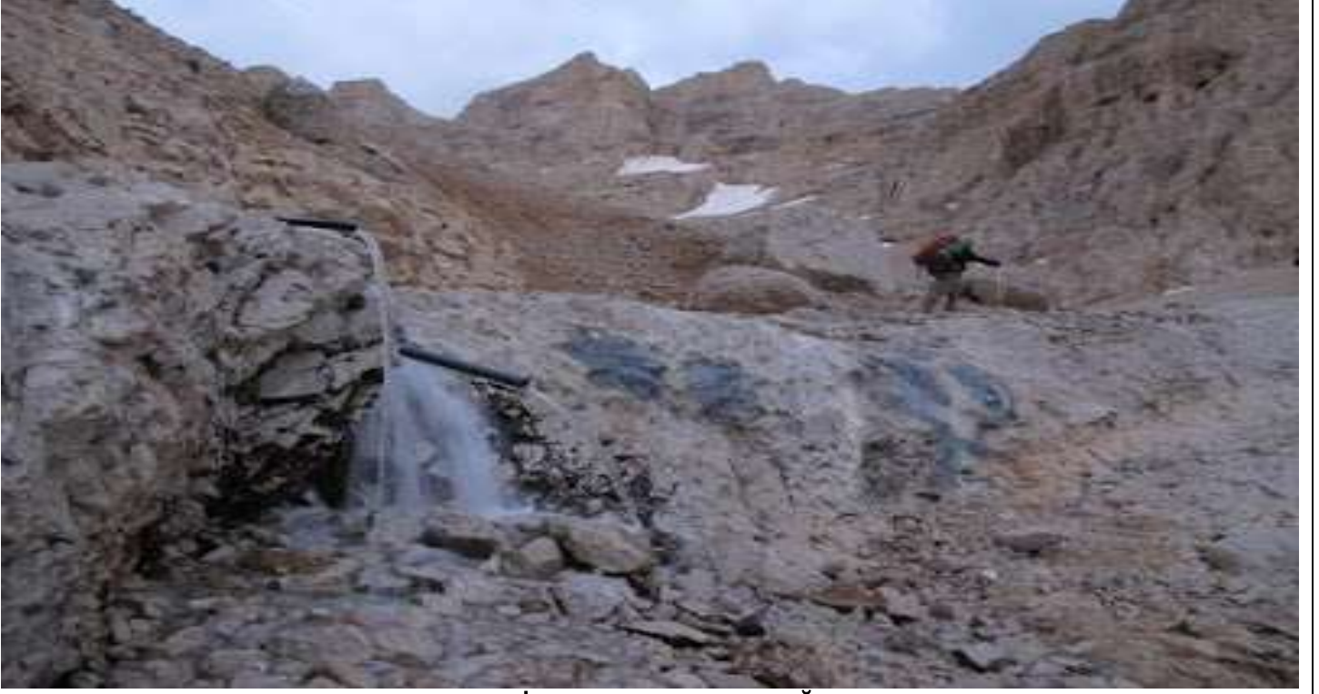
ÇELİKBUYDURAN SU KAYNAĞI

Çelikbuyduran kamp alanı molasından sonra zirveye yürüyüşümüz devam etti ve 07:00-07:30 arasında tüm ekip zirveye ulaştık. Resimden de anlaşılacağı üzere zirvede kar vardı.